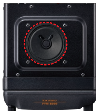
Altavoz de 3 W (66 mm)

Un altavoz de 3 W asegura un sonido claro y nítido. El circuito se ha ajustado específicamente para obtener un audio de buena calidad. Podrá disfrutar de comunicaciones con una calidad de audio excepcional incluso en entornos ruidosos o al aire libre.